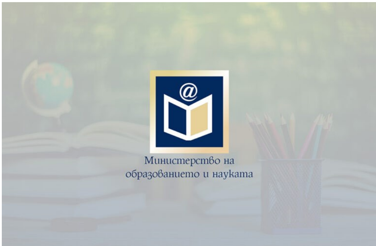
Министерство на образованието и науката

Министърът на образованието и науката проф. Галин Цоков ще представи анализ на резултатите от националното външно оценяване след 7. клас утре (2 юли) в МОН. Брифингът ще се проведе от 10:00 часа на Ротондата на петия етаж.